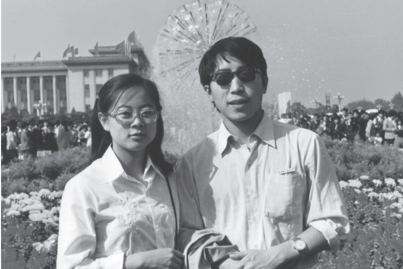
1980年代末，作者在北京读研期间与女友合影