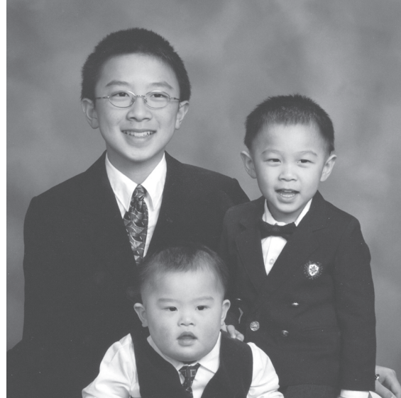
作者的三个儿子，摄于2005年

藉着《圣经》中上帝的宝贵应许，“我们若认自己的罪，上帝是信实的、是公义的，必要赦免我们的罪，洗净我们一切的不义，”（《约翰壹书》1:9）我知道，因着上帝的儿子耶稣基督在十字架上为我付出的代价，我的罪已经得到上帝的赦免。圣灵也赐我内心平安，印证我的罪确实已蒙上帝赦免，我已经与爱我的天父和好，回到了他的家里，成了蒙爱的孩子。