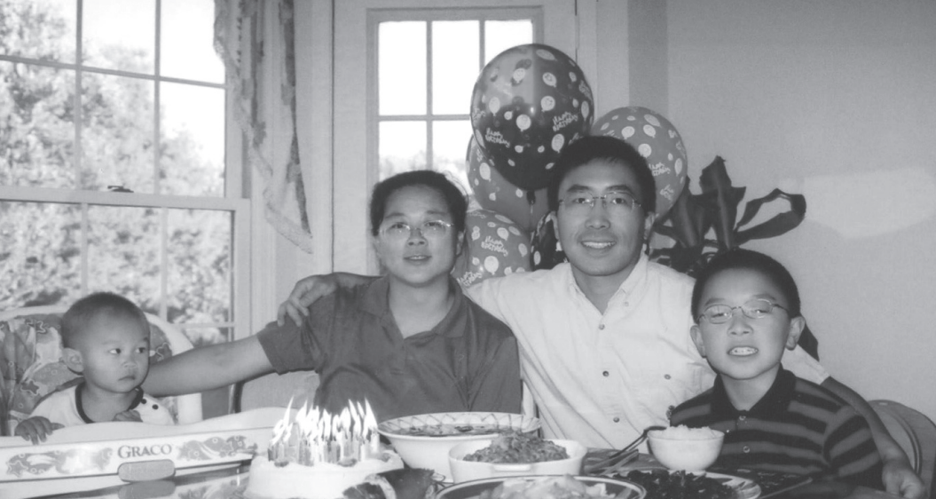
重建后的家庭：2002年作者全家摄于美国密西根州