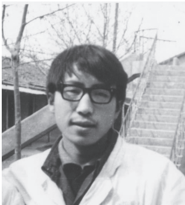
我是一匹北方的狼！——80年代初读医学的作者

在北京读博士期间，我的办公室与学校马列主义哲学教研室相邻，使我有机会向哲学老师们学习、讨教一些哲学问题，包括人性的本质、