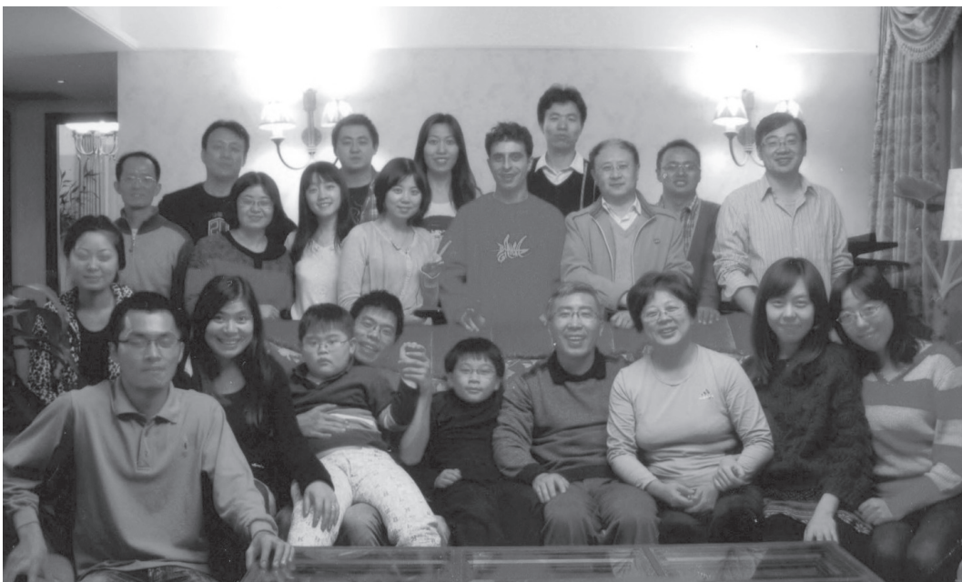
2011年，作者和妻子(前排右4/右3)在北京工作期间，接待团契弟兄姊妹在家中查经

像攀登黄金阶梯 每重担越挑越轻省 每朵云披上银衣 在那里阳光常普照 在那里没有眼泪 在美丽彩虹的尽头 众山岭与天相连