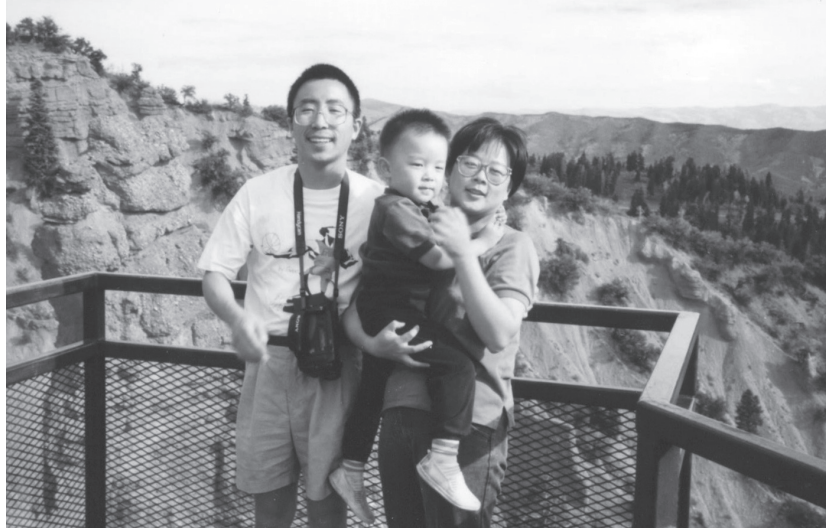
1997年，作者（左）在美国盐湖城与妻子、儿子合影

看病。由于工作是我的“偶像”，于是我心里越来越不满，每次不情愿地当完“司机”回来后都会对她发泄不满，责怪她“又耽误了我半天的工作”。