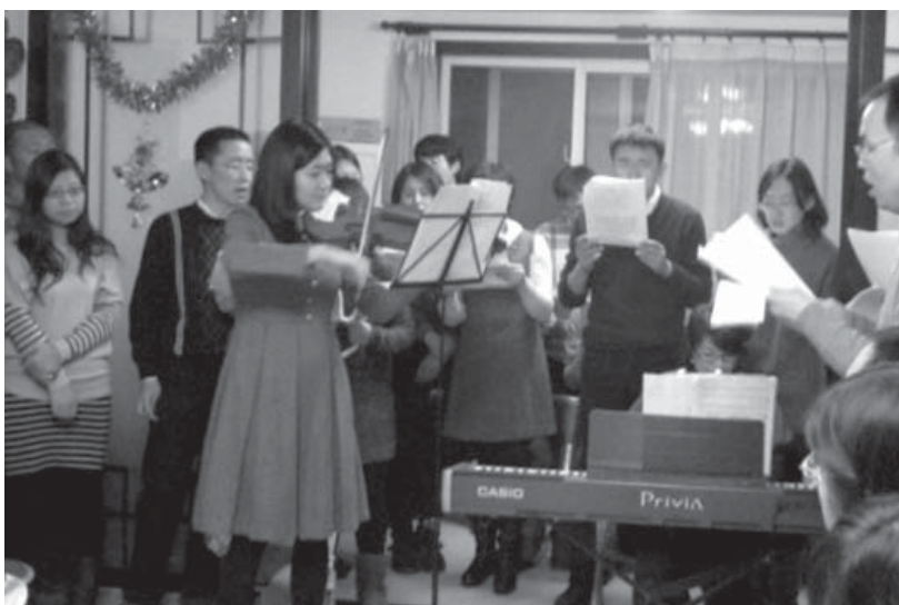
作者(左三)在2012年聖誕節傳福音聚會中，小提琴獨奏“膏主女僕”

只是背诵和思考经文，不代表能迈出行动的步伐。若不寻求实际应用，那么圣经仅仅是一本历史书。但上帝给我们圣经的心意本不是如此，他想要圣经成为我们实际生活的指导，让我们有所行动。