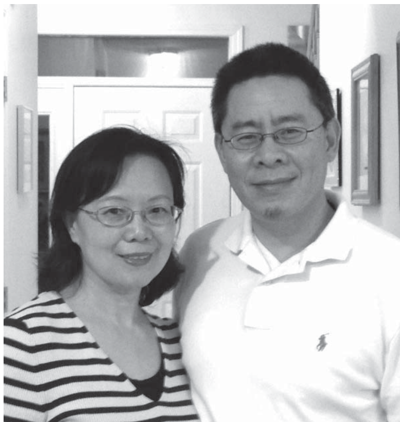
圖為作者夫婦，他們在新浪微博的名字是“喜樂的平南”