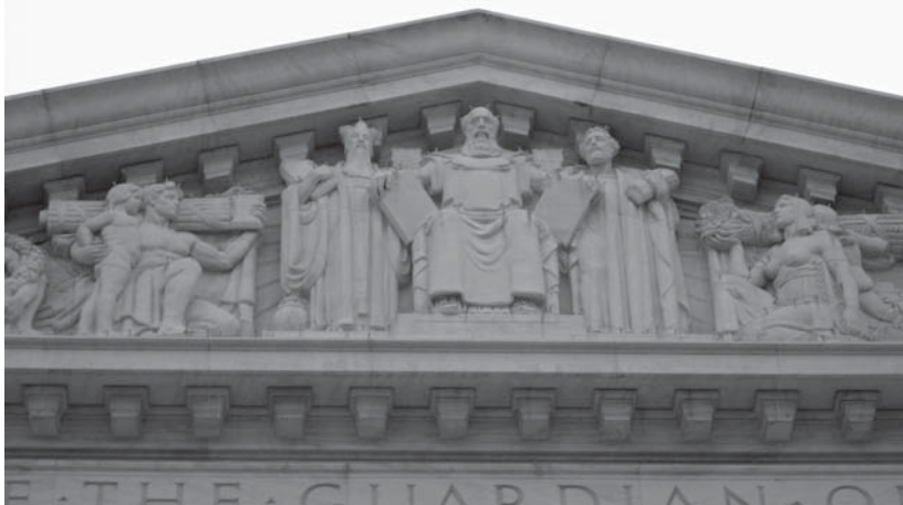
美國最高法院建築物東門正面的塑像：手持十誡的摩西