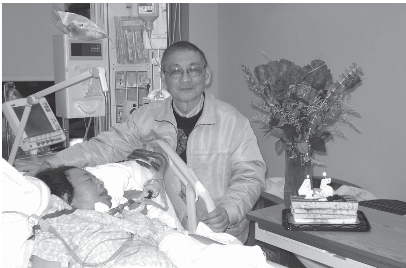
2009年，郭牧師師母結婚45週年紀念日在ICU（加護病房）度過

回答，而是引导他去观看神伟大奇妙的创造。他把人的注意力从苦难的起因转移到对苦难的回应上来。神要在苦难中改变我们。