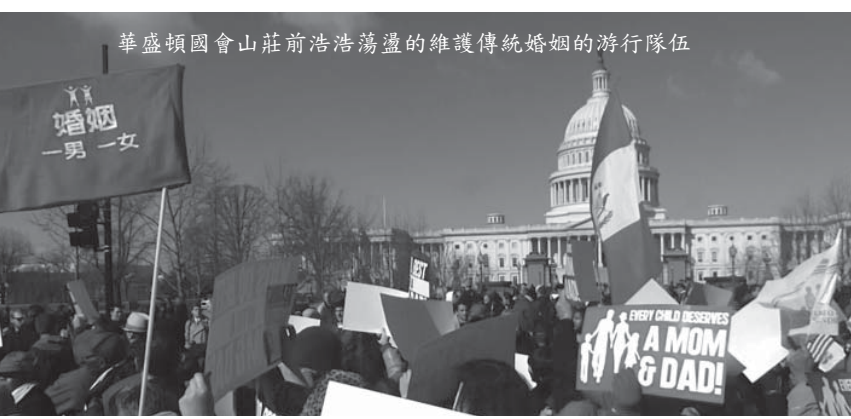
華盛頓國會山莊前浩蕩盪盪的維護傳統婚姻的游行隊伍