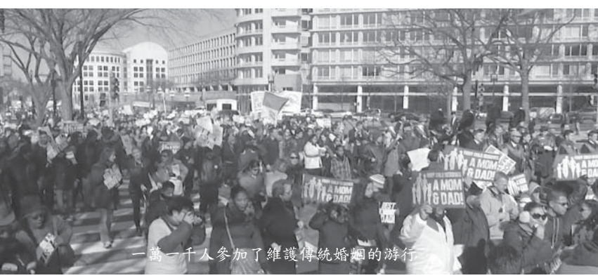
一萬一千人參加了維護傳統婚姻的游行