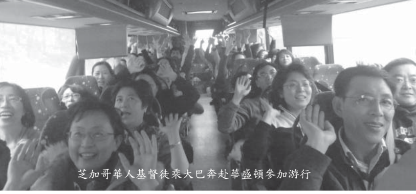
芝加哥華人基督徒乘大巴奔赴華盛頓參加游行