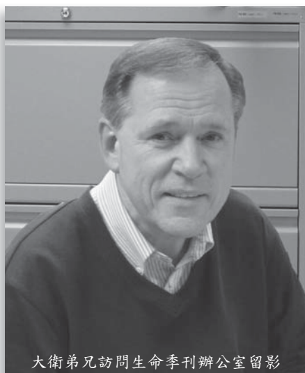
大衛弟兄訪問生命季刊辦公室留影