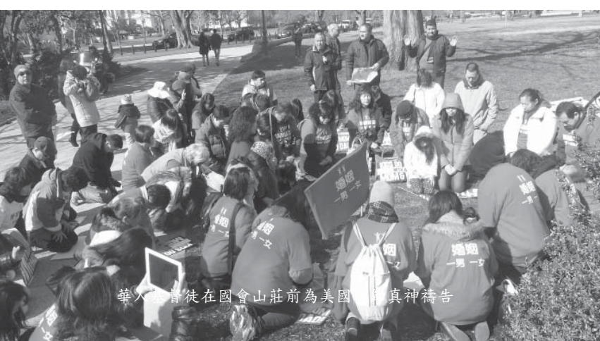
華人基督徒在國會山莊前為美國禱告

Greg Harris本身是同性戀者，同時患有艾滋病。他自2007年2月，就提出支持同性戀的議案；被否決後，於2009年1月再次提出，被否決；同年10月，女議員Steans提出“同性婚姻合法化”議案，被否決；2012年2月，Harris又一次提出自己的議案，再次被否決。2012年12月，Harris和Steans聯手提議，2013年1月3日，他們的議案被否決。1月9日、10日，二人分別提出新的議案，2月14日，參議院通過該議案SB10，交至下議院。目前，該議案需要由眾議院118位議員投票，若有多數贊成，該議案就成立了。 13