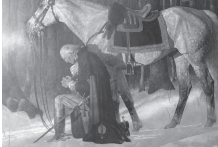
美國第一任總統華盛頓在禱告

美，有他特别的旨意。在北美，华人进入了一个完全与过去文化不同的环境，一个多元的、心灵和信仰可以自由碰撞的环境。国内知识分子到达北美后，使他们深感惊诧的是优美的自然环境和自由的人文环境；而路旁林立的教堂，更像象征着一种信仰精神的存在。有人甚至说：美国的空气中都浸蕴着一种基督信仰精神。