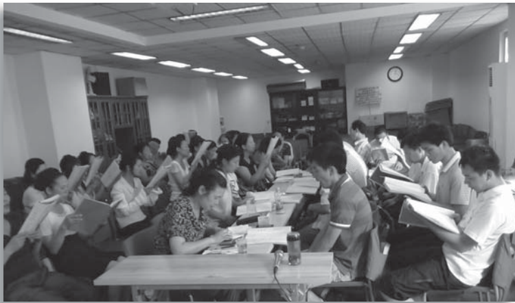
弟兄姊妹查经预备传福音