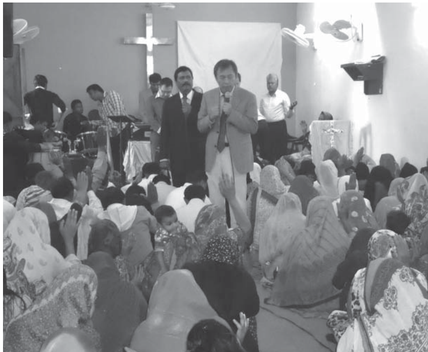
巴基斯坦基督教教会的主日敬拜