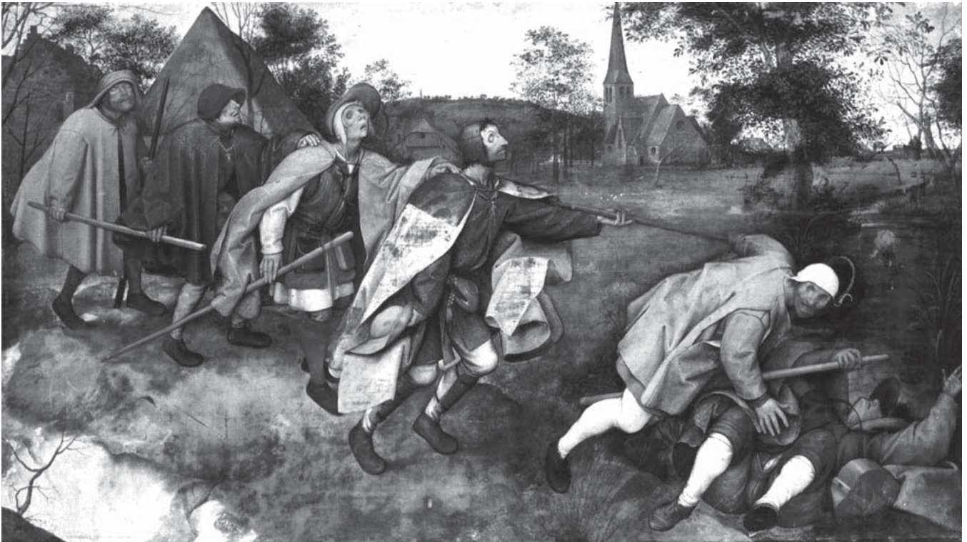
《瞎子领瞎子》 油画, Pieter Bruegel (Brueghel) the Elder (1525 - 1569)作 参马太福音15: 14