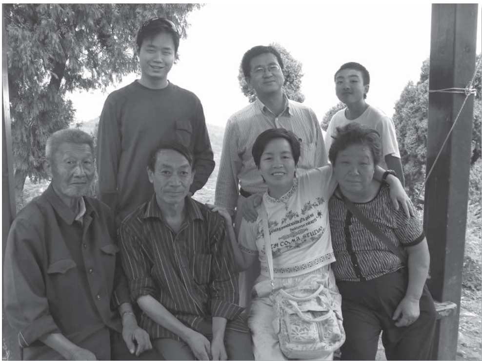
本文作者（后左一）在事奉途中

要，口才的需要。但是肉体就是这样，当这一股劲过去的时候，读经的味道就变得干瘪了，再也没有那种从早到晚都渴慕翻阅圣经的冲动了。老实说，那时候的我，太缺乏经历神的大能了，太注重通过语言知识来感动听众了。所以我不是一个合格的讲员。我还发现不只是我，很多追求头脑领悟的人，都会这样，他们在神的道中插入一些令人发笑的故事或者见证，妄图取悦会众，使他们在一种那种的方法中获取对神的信靠和信心。渐渐的，我暗暗地觉得这样有些不对，于是总和自己较力，有时候一场道下来，会众中没有笑声或者认同声，以扫的我便会若有所失。就这样，我在以扫和雅各的较量中逐渐认识到自己的伪善，我不是一个真正爱真理、爱羊群，宣扬神话语的传道人，因为我太在意会众的反应了！以扫曾经为了一碗红豆汤出卖长子的名分，中国西周时周幽王，为褒姒一笑，点燃了烽火台，这些类似的故事，都说明图一时之快，必要付出长久乃至生命的代价。