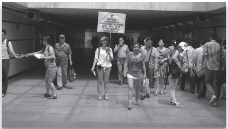
在火车站出口通道传福音

话，说你们教会的人到处传耶稣，公汽、轻轨、地铁、广场，领导都惊动了。我说基督徒个人传耶稣是言论自由不违法，他们也没有再说什么。