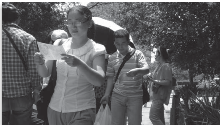
在广场边分发福音单张