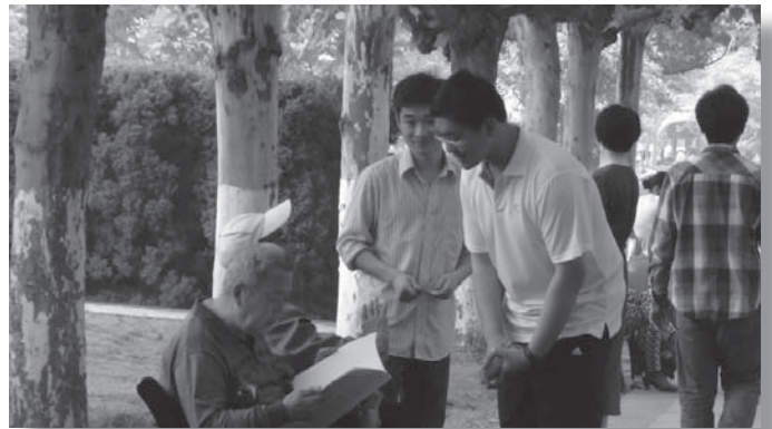
在公园向老人家传福音