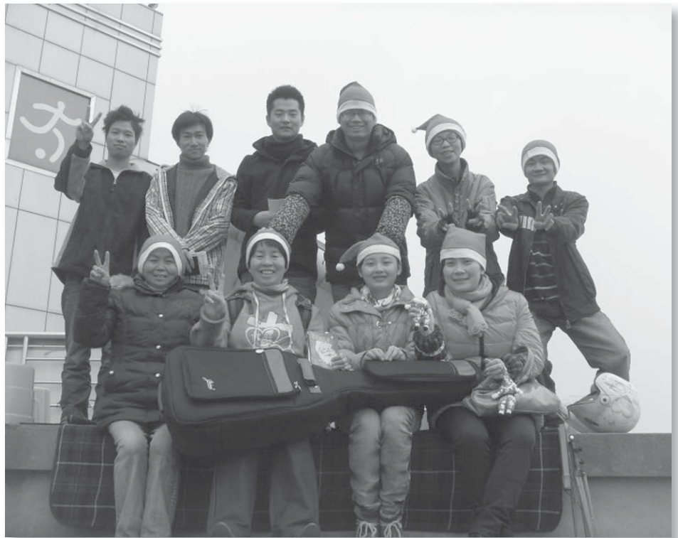
圣诞节户外敬拜，后排左4为本文作者

老实说，从我被迫离开母会，到如今植堂已经有两年了，给我造成最大风雨的是枕头风，没有服事好妻子就妄想服事好教会的人，是忘记了神的叮嘱。好好管理自己的家，使儿女凡事端庄、顺服。人若不知道管理自己的家，焉能照管