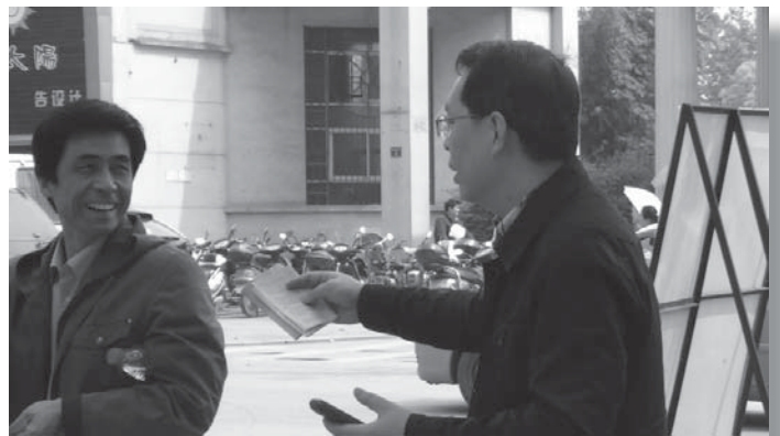
请收下！福音本是好消息！