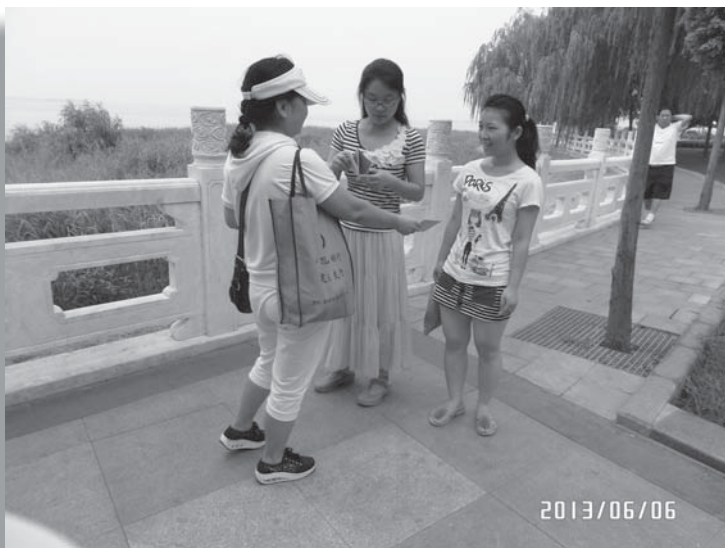
题图：在公园分发福音单张