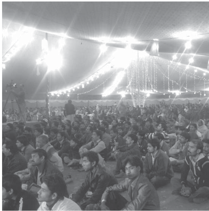
巴基斯坦每月一次的基督徒奋兴会

的弟兄作为少数族裔实在被逼迫太厉害了。我们中国人的到来，对他们是何等的鼓励和激励。我们也讨论了明年在巴基斯坦组织超十万人的奋兴会，牧师培训等事工，同时决定马上筹备成立巴基斯坦基督徒商人全国委员会。