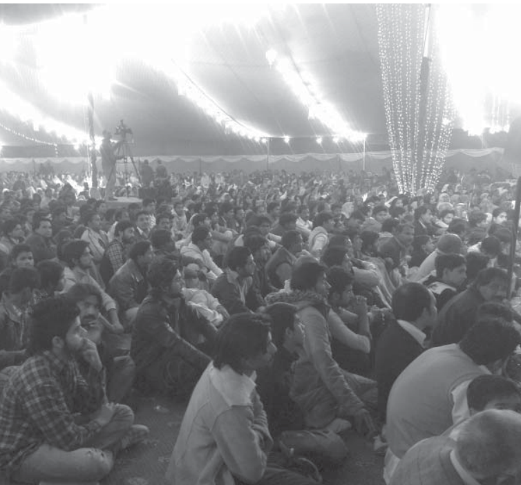
巴基斯坦每月一次的基督徒奋兴会