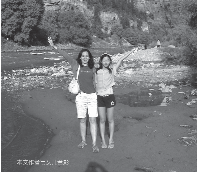
本文作者与女儿合影

接着我又对她讲，“在一条街道上停着一辆小汽车，它的样式非常漂亮。它有很多特别的功能，电视，MP3播放器，高级音响设备，等等……”宁宁插嘴道“我知道有的车上可以放电视。”我点点头，接着说：“可是这车却有一个缺点。那就是它的引擎上有个大洞。有个洞的结果是：这辆车没法开动。可车子本身设计是用来开的。没法开的车，再多漂亮，再多的功能，也