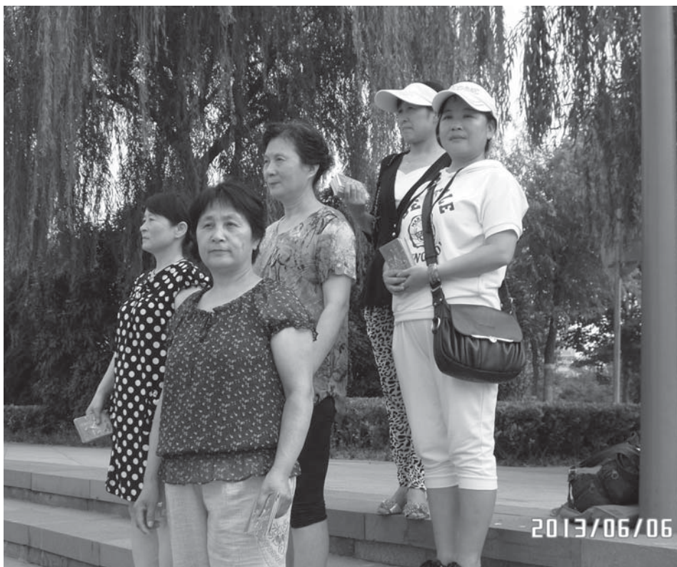
传福音派单张的姊妹们，中为本文作者

手发的同时口中措辞要跟上，有个很好的开场白。比如你的单张是《请安问好》，就说：“给你请安问好，上帝祝福你，耶稣赐你全家平安。”如果是《怎样获得最好礼物》，就说：“耶稣爱你，上帝祝福你，赐你永生。”见到老年人就亲切地喊：“老伯伯，给你送个福气，上帝赐你平安。”或是说：“老伯伯，耶稣