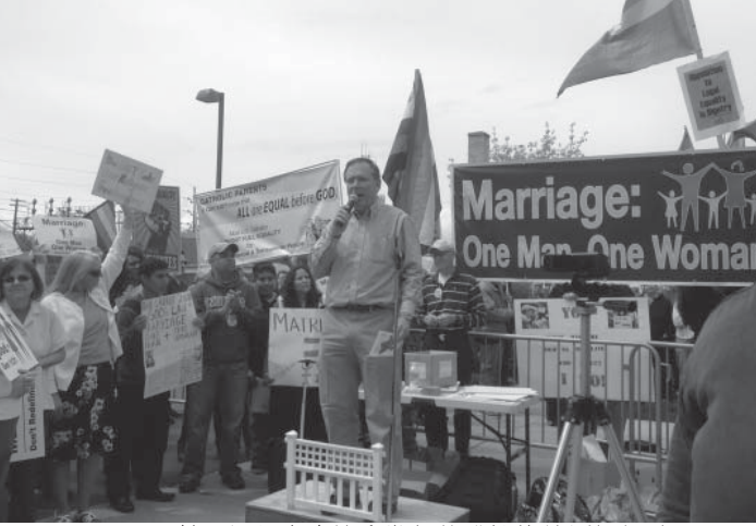
5月4日，美国伊州家庭协会发起的维护传统婚姻行动