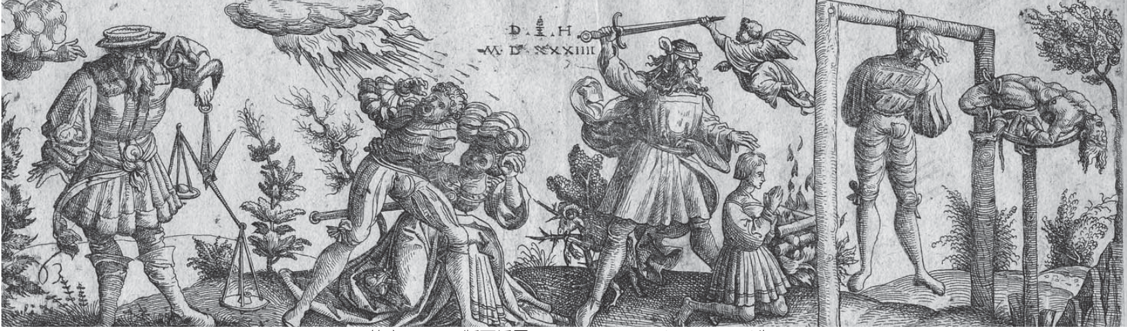
箴言10: 4-7版画插图, Daniel Hopfer (1470 - 1536)作

DEN SEGEN HAT DAS ABER DEN MYND DER DAS GEDAECHTNYS DER ABER DER GOTTLOSEN HAVPT DES GERECHTEN GOTLOSEN WIRT IR PRF GERECHTEN BLEIBT IM NAME WIRT VER WESEN VEL VBERFALLEN SEGEN