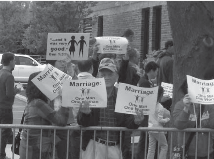
华人教会积极参加维护传统婚姻的行动