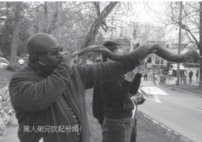
黑人弟兄吹起号角！