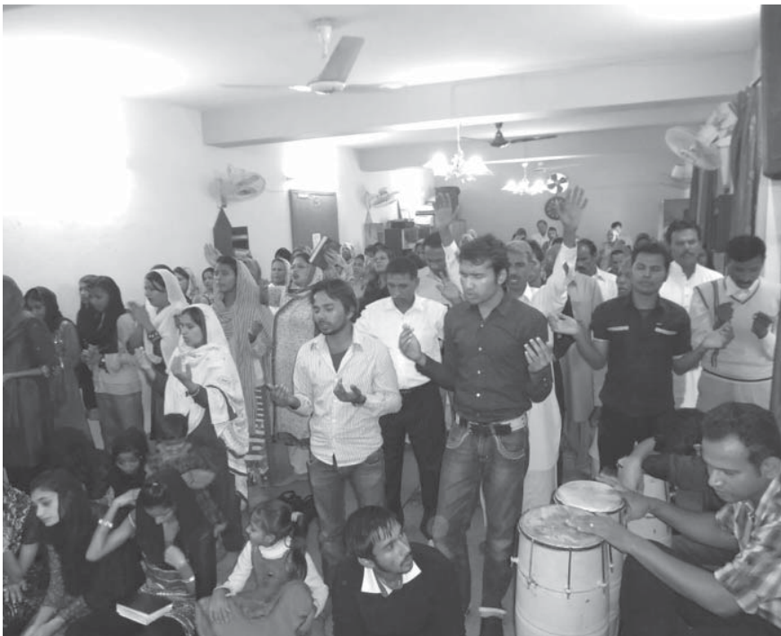
巴基斯坦弟兄姊妹击鼓弹琴赞美主