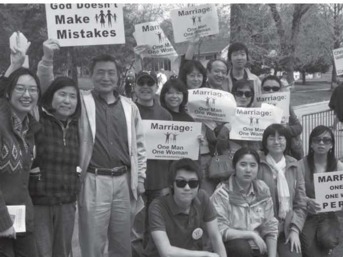
参加维护传统婚姻行动的部分传道人及弟兄姊妹