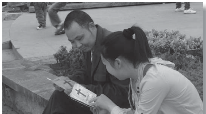
你听过耶稣的名字吗？