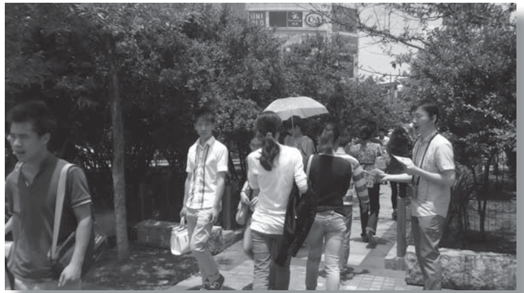
在路边分发福音单张